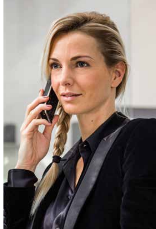
Abbildung 1. Alcatel-Lucent OpenTouch™ Suite für KMU - Angebotsübersicht

Das Portfolio ist zuverlässig, offen und basiert auf Standards. Die Alcatel-Lucent OpenTouch™ Suite für KMU ist auf allen Ebenen modular - von Kommunikationspaketen und Softwarelizenzen bis hin zu Kommunikations-Servern und Netz-Infrastrukturen, die genau auf die Anforderungen der Kunden abgestimmt sind. Sie können dieses Portfolio mit einer Hardwaregarantie und zahlreichen Leistungen erwerben: vom einfachen Wartungsvertrag bis zur kompletten Systemaufrüstung für neue Anwendungen und Technologien. Die Alcatel-Lucent OpenTouch™ Suite für KMU ist zukunftsorientiert, basiert auf der OmniPCX™ Office Rich Communication Edition (RCE) - einem leistungsstarken und flexiblen IP-Kommunikations-Server mit Standardprotokollen - und bietet eine Reihe leistungsfähiger Merkmale.