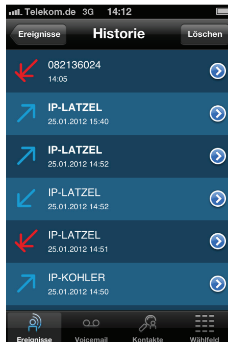
Screenshot von My IC Mobile für iPhone